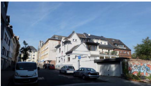
Situation entlang der Croonsallee