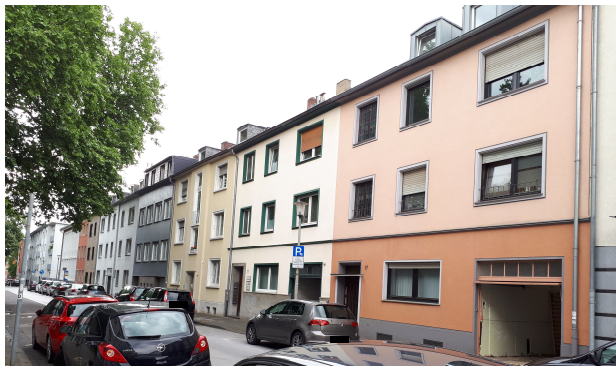
Kleiststraße (Richtung Süden)