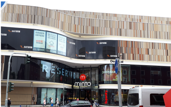
Steinmetzstraße Eingang MINTO