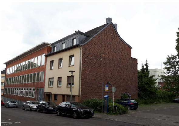
ehem. Finanzamt, Yorckstraße 9, Parkplatz (v.l.n.r.)