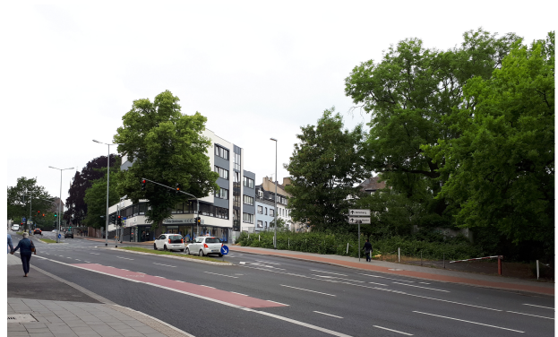
Steinmetzstraße (Plangebiet rechts)