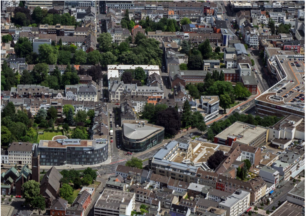
Croonsquartier mit Umfeld