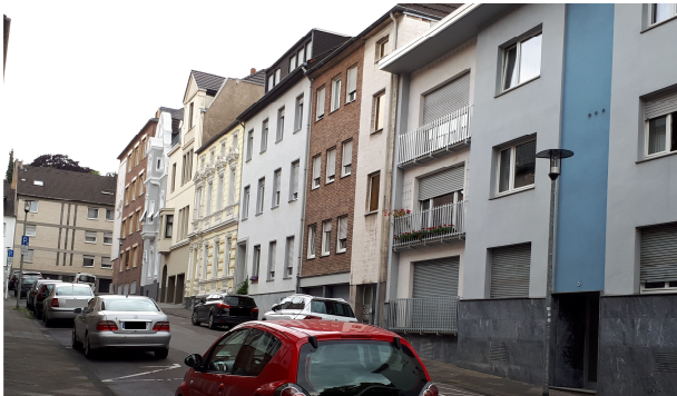
Yorckstraße (gegenüber Plangebiet)